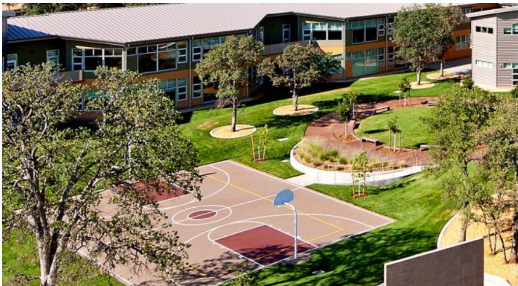
1-rasm. Umum ta'lim maktabi hududi landshafti.

Maktab atrofida zamonaviy landshaft arxitekturasin yaratish. Qolabersa yosh avlodni tarbiyalashta ularning amaliy dars vaqtida ko'zlari bilan kursa tanishssa bu albatta natijja beradi. Shunki amaliy dars vaqtida o'quvchi gullarning parvarishi, ularning qay tarizda joylashishi va boshqa sir asrorlarini urganadi. Yuqorida aytib o'tkanimizdek, ularning ichida xol buki bu soxaga degan qiziqishin uyg'ata olsak biz maqsadga erishkan bulamiz